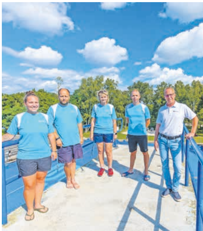
Mitarbeiter der Sparte Bäder grüßen vom 10-Meter-Turm

Freibad und Schwimmhalle fiwave sind bei den Besuchern sehr beliebt