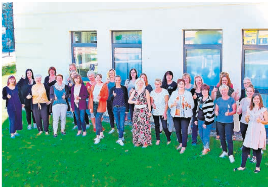
Die Frauen der Stadtwerke Finsterwalde sind echte Power-Frauen!

ting und Öffentlichkeitsarbeit verantwortlich, steuern und unterstützen den Verkaufsservice, sorgen für korrekte Abrechnungen, bearbeiten den Marktdatenaustausch mit anderen Lieferanten und Netzbetreibern, haben die kaufmännische Abteilung fest in ihrer Hand, bereichern das Bäderteam als Schwimmmeisterin und Fachangestellte, geben Netzauskünfte, sind für den Einkauf zuständig, werden hochwertig ausgebildet und sorgen immer für gute Laune!