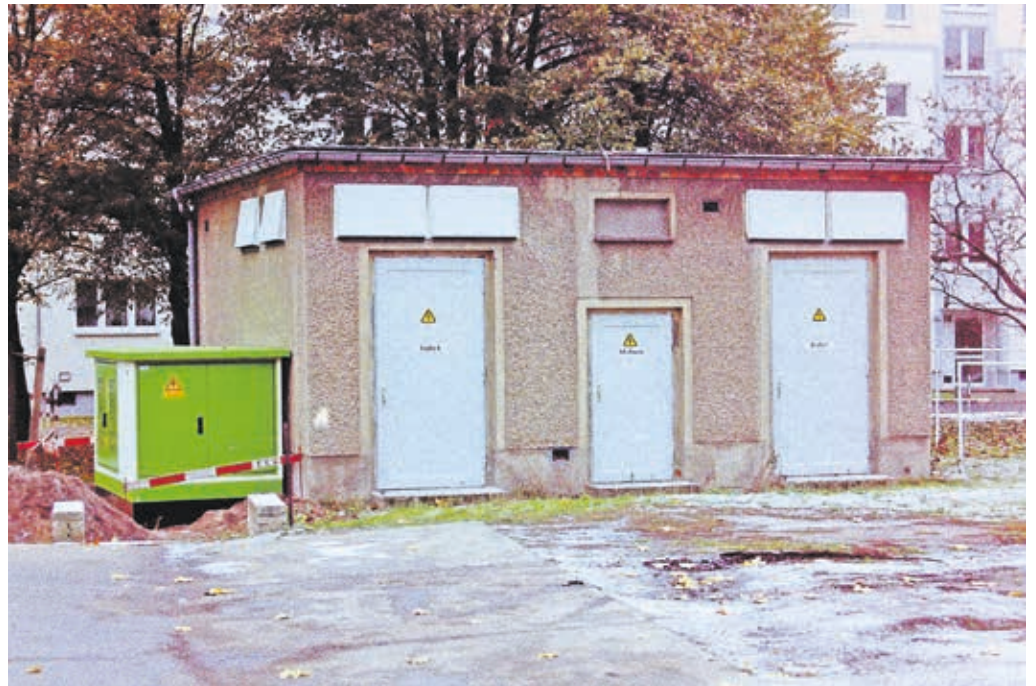
In den letzten 30 Jahren hat sich auch das Aussehen der Trafostationen geändert – vom Trafohaus zu kompakten Trafostationen (hier links zu sehen)

Vielmehr noch: Über 13.000 Kunden, auch über die Grenzen des Netzgebietes und damit der Stadt Finsterwalde hinaus, erleben die erstklassige Arbeit bei ihrem kommunalen Stromversorger. Tag für Tag, rund um die Uhr. Garantiert auch in Zukunft! Die hat bei den Stadtwerken längst begonnen. Der Service für die Kunden reicht über die Vielzahl der