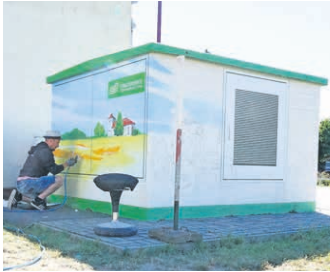
Die Trafostation in Sorno wurde farbenfroh gestaltet

Sie sind echte Hingucker, richtige Kunstwerke. Wunderschön sowieso. Schließlich bringen die Stadtwerke mit ihnen Farbe ins Leben, machen Stadt und Umgebung bunter. Gute Laune inklusive. Die Rede ist von den großflächigen Motiven, die u. a. bereits die Trafostation in Sorno, die Gasdruckregelanlage und den Glasfaserverteiler in der Tuchmacherstraße und einen Block der Wohnungsgesellschaft schmücken.