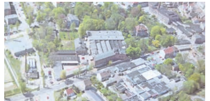
Das heutige Gelände der Stadtwerke Finsterwalde mit der damaligen Bebauung. Links sieht man das Heizhaus, mit dessen Betrieb für die Wärmeenergieerzeugung die Geschichte der Stadtwerke begann.

„Vor dem Hintergrund und den Zielen der Klimawende planen wir die Umsetzung eines innovativen Kraft-Wärme-Kopplungs-Projektes“, verrät Andy Hoffmann und ergänzt: „Auf Basis von Erdgas sollen hier Strom und Wärme in einem hocheffizienten Blockheizkraftwerk erzeugt werden.“ Doch damit nicht genug. „Ab dem Jahr 2024 soll eine Solarthermieanlage die Wärmeenergieerzeugung der Stadtwerke begleiten. 30 Prozent der Wärme werden damit künftig aus dem Blockheizkraftwerk und aus der Sonnenenergie erzeugt und einen Teil der konventionellen Energieerzeugung aus den vorhandenen Gasheizkesseln ersetzen“, ergänzt Thomas Freudenberg, Bereichsleiter Rohrnetze. Das große