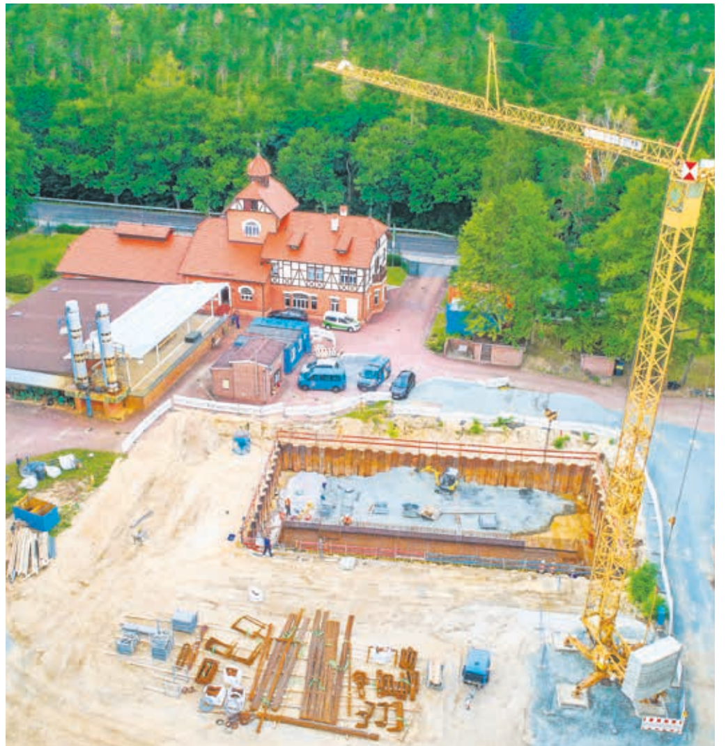
Blick auf die Baustelle des neuen Wasserwerkes, das 2024 in Betrieb genommen werden soll

Über acht Millionen Euro investieren die Stadtwerke in den Neubau, welcher im ersten Halbjahr 2024 fertiggestellt